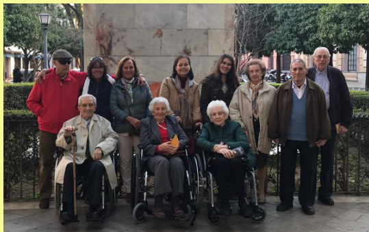
Visita al museo de Bellas Artes