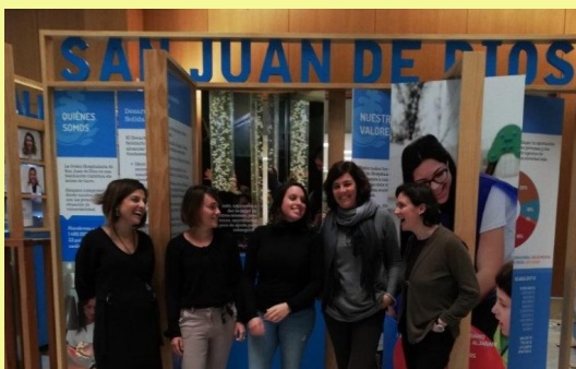
Día de la Granada Azul