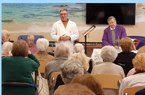
Imposición de las Cenizas el miércoles 6 de marzo.