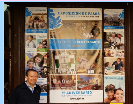
Exposición de pasos de Semana Santa en Miniatura en nuestra Iglesia hasta el 12 de abril de lunes a sábados de 11h a 13h y de 17h a 20h.