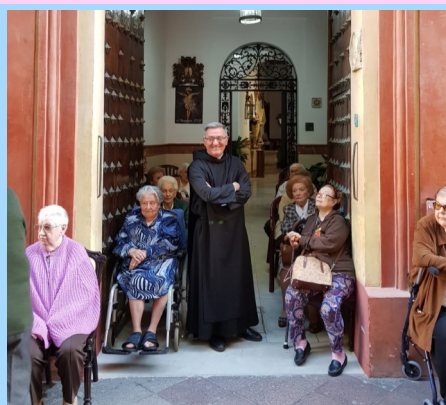
Viendo el Vía Crucis el 11 de marzo.