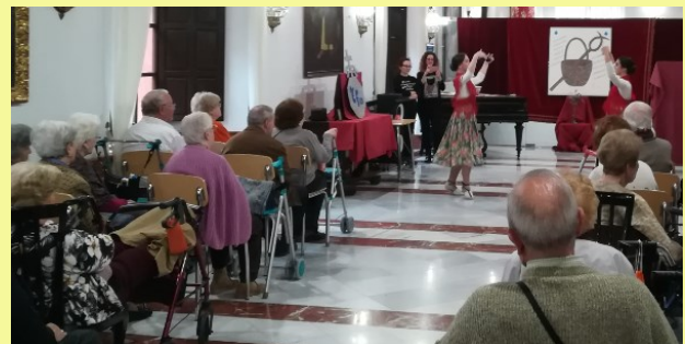
Actuación Conservatorio de Danza