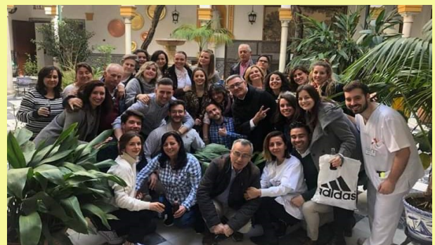
Festividad de San Juan de Dios